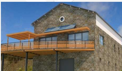
Exemple de bâtiment rénové « low-tech » combinant solutions innovantes et durables en exploitation

Soucieux des enjeux d'exploitation et de confort des usagers, PANDOPIA conseille les Maîtres d'Ouvrage pour que la conception se réalise dans une optique de coût global optimisé . Les solutions passives, robustes, limitant la complexité des interventions en maintenance et exploitation correspondent à une philosophie du bâtiment « low-tech » à laquelle PANDOPIA est attaché. Ainsi nous situons nos interventions dans une dynamique d'équilibre entre solutions innovantes et solutions reconnus par le passé .