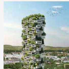
Exemple de projet « vert » peu durable en exploitation

La surenchère des objectifs environnementaux en construction a poussé le secteur du bâtiment vers des solutions toujours plus innovantes. Néanmoins, la sectorisation des différents acteurs ainsi que la complexité à appréhender l'exploitation ont marqué l'apparition d'écarts toujours croissants entre le monde théorique de la conception et le monde réel de l'exploitation . Malgré l'énorme foisonnement de labels environnementaux et énergétiques, le fossé reste présent et les Maîtrises d'Ouvrage souhaitent désormais le retour d'un juste équilibre des solutions afin que l'innovation reste rattachée à une réalité de terrain.